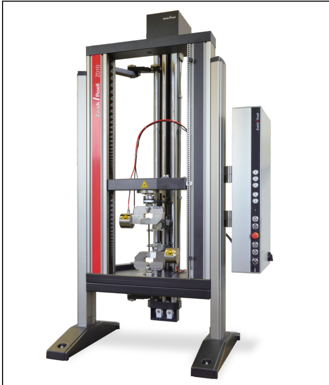
Langweg-Längenänderungsaufnehmer an einer Z010 der Allround-Line